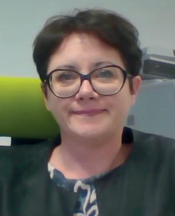
Directrice agence de recrutement