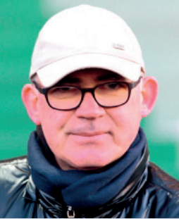
Éleveur, entraîneur de chevaux de courses